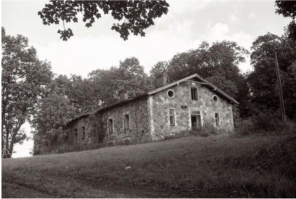
Foto 5. Tõdva-Kõnnu mõisa töölistemaja. 37