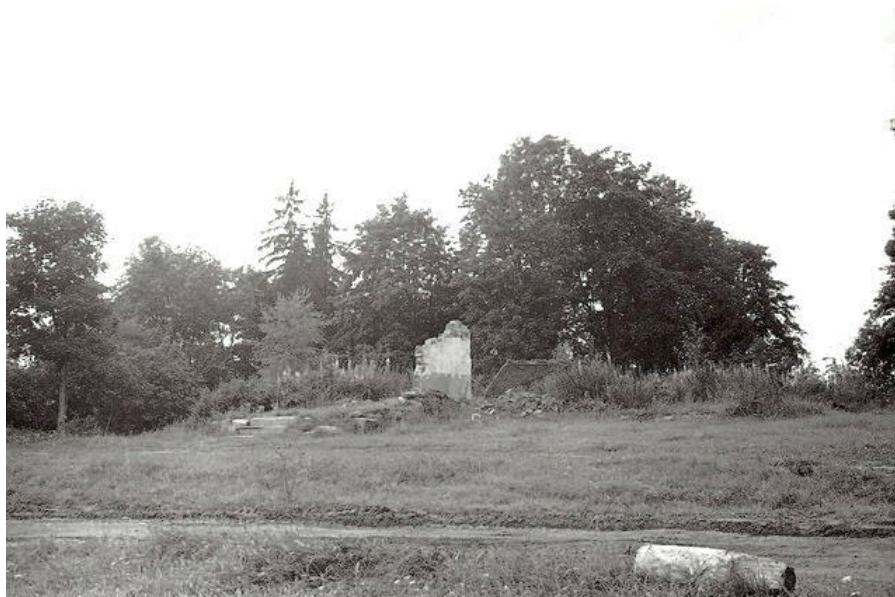
Foto 2. Tõdva-Kõnnu mõisa peahoone vare. 29

Nagu eespool juba mainitud, hävis teadaolevalt Tõdva-Kõnnu mõisa peahoone 1967. aastal tulekahjus ja täna (2015) on seda kohta meenutamas eel ainult vundament (fotod 2 ja 3).