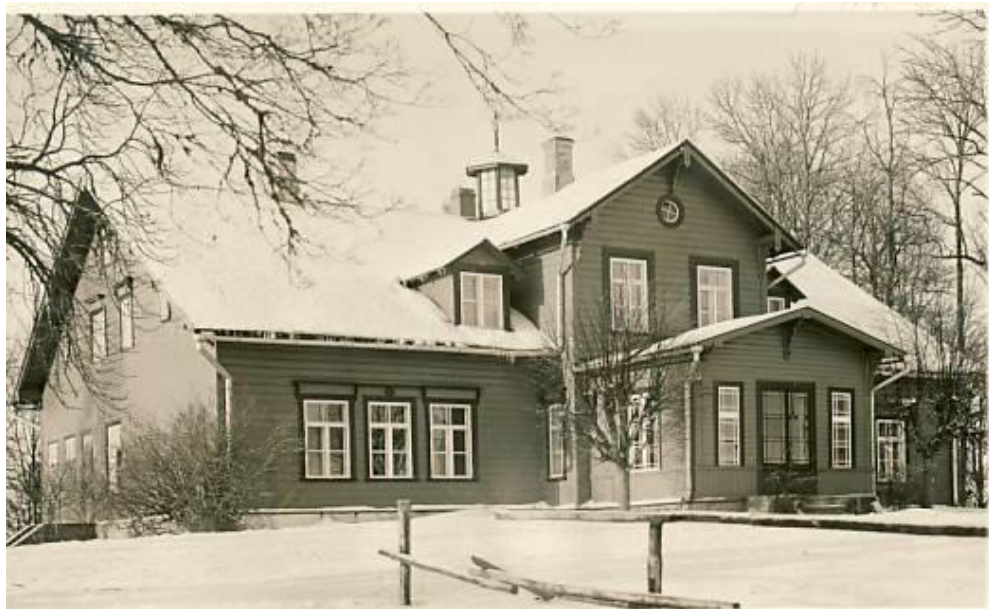
Foto 4. Tõdva-Kõnnu peahoone enne teist maailmasõda. 32

Hoone oli suhteliselt väike puithoone 30 (foto 4). Härrastemaja katusel oli lühike kuuskandikujuline klaastorn, mis valgustas ülemise korruse koridori. Peahooneel oli kolm korsten, kaks väiksemat ja üks lai korsten. Peasissekäigu ees oli dekoratiivklaasidega palkon ehk paraadna. Palkoni ees oli kolmeastmeline pruunist graniidist trepp. 31