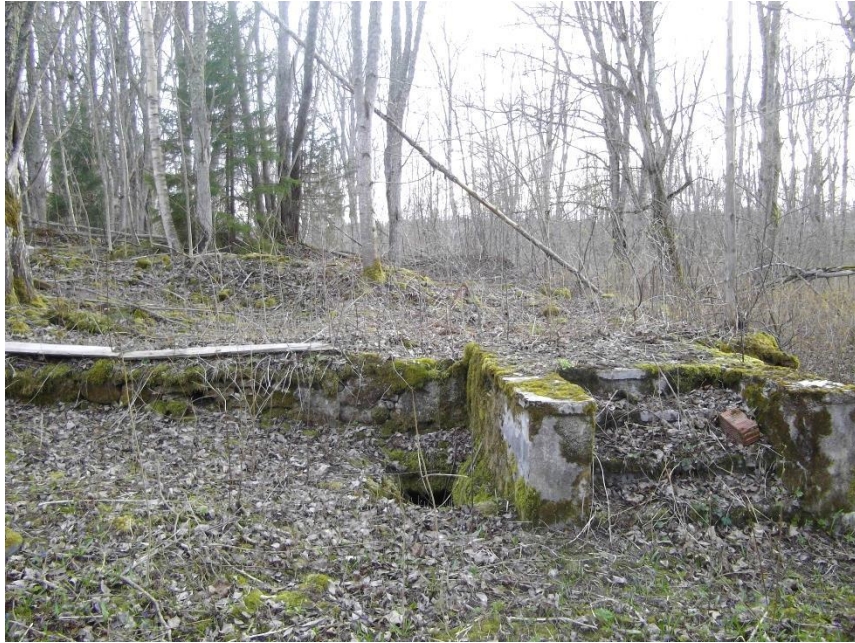
Foto 3. Endise Tõdva-Kõnnu härrastemaja vundament (2015).

Hoone oli suhteliselt väike puithoone 30 (foto 4). Härrastemaja katusel oli lühike kuuskandikujuline klaastorn, mis valgustas ülemise korruse koridori. Peahooneel oli kolm korsten, kaks väiksemat ja üks lai korsten. Peasissekäigu ees oli dekoratiivklaasidega palkon ehk paraadna. Palkoni ees oli kolmeastmeline pruunist graniidist trepp. 31