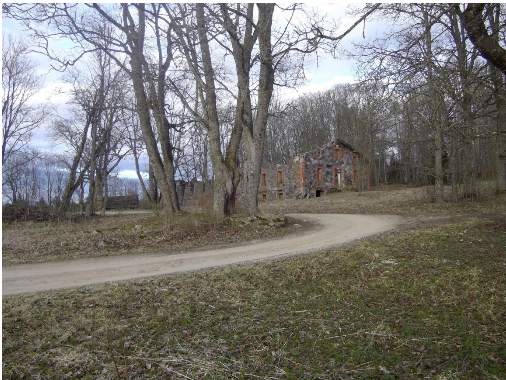
Foto 6. Tõdva-Kõnnu mõisa töölistemaja varemed (2015).