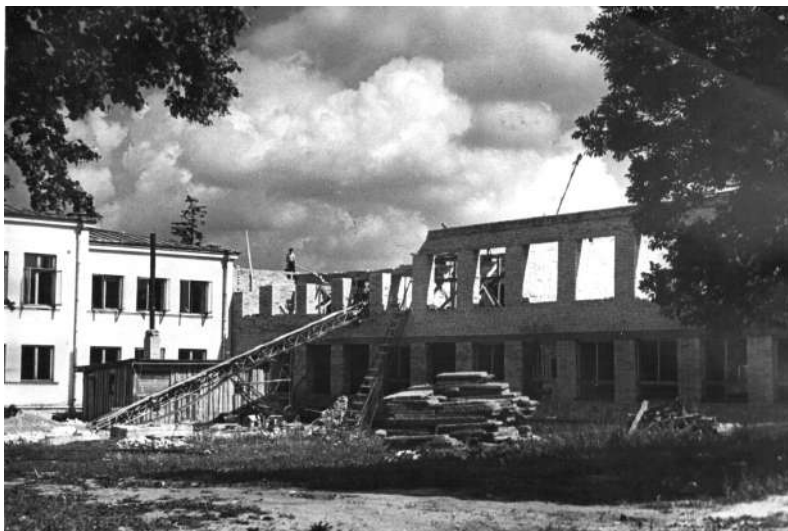
... ja kaht maja ühendava nn. B-korpuse kätte.