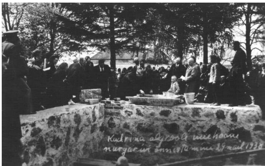
Uhke koolihoone nurgakivi pühitseti 29. mail 1938.aastal.