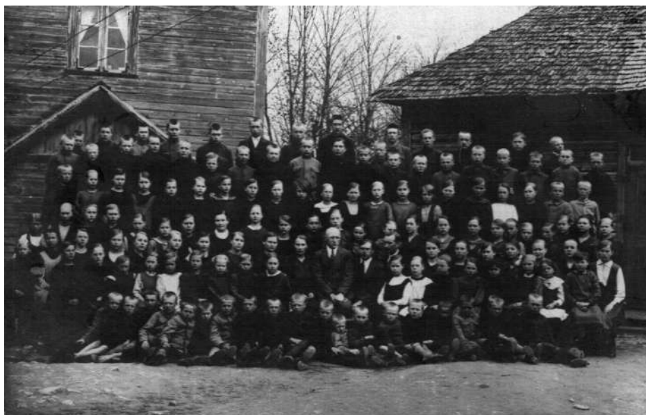
Juba sellel, 1921.a. fotol on aimata, et klassitoad olid kitsaks jäämas. Uue majani jäi aga veel 18 aastat.