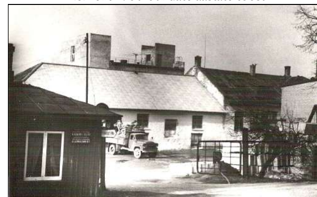
Kadrina tärklisevabriku peavärav 1968. aastal.