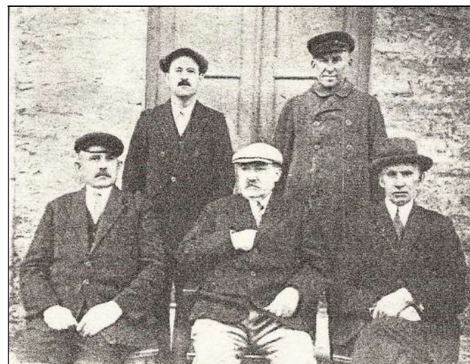
OÜ „Viru“ Kadrina vabriku ametkond.

Kadrina tärglise- ja siirupivabrik pälvinuks väarikamat lõppu kasvõi muuseumi näol (vrldl paemuuseum, piimandusmuuseum, piiritusmuuseum).