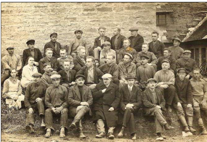
Tärklisevabriku töötajad Kadrinas 9. mail 1933