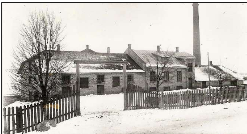
Kadrina tärklisevabriku värav 1930ndail aastail.