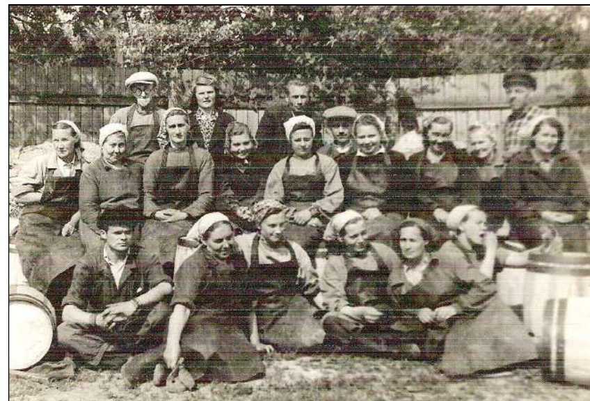
Tärklisevabriku töökollektiiv 1950ndate aastate lõpus.