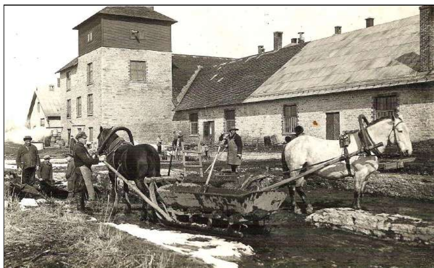
Ilma vana hea abilise hobuseta ei saadud tärklisevabrikuski hakkama.