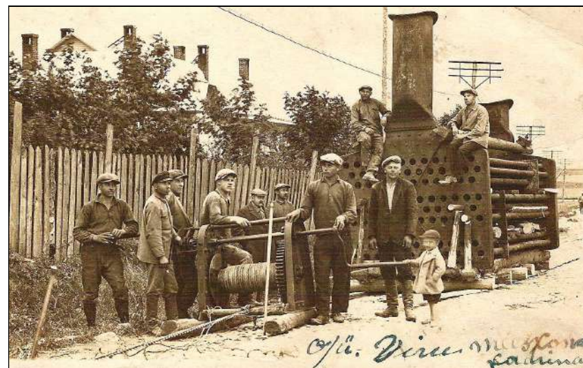
Mehed katlavahetuse tööhoos 1930ndail aastail.

Ostes käesoleva trükise, toetate Neeruti ja selle lähikonna loodushoidu, kultuuriloo jäädvustamist ja Neeruti Seltsi, mis selle nimel ellu on kutsutud.