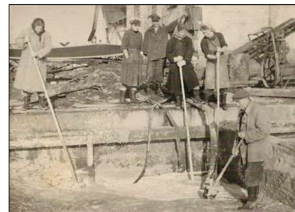
Moment 1950-60ndate aastate tööst.