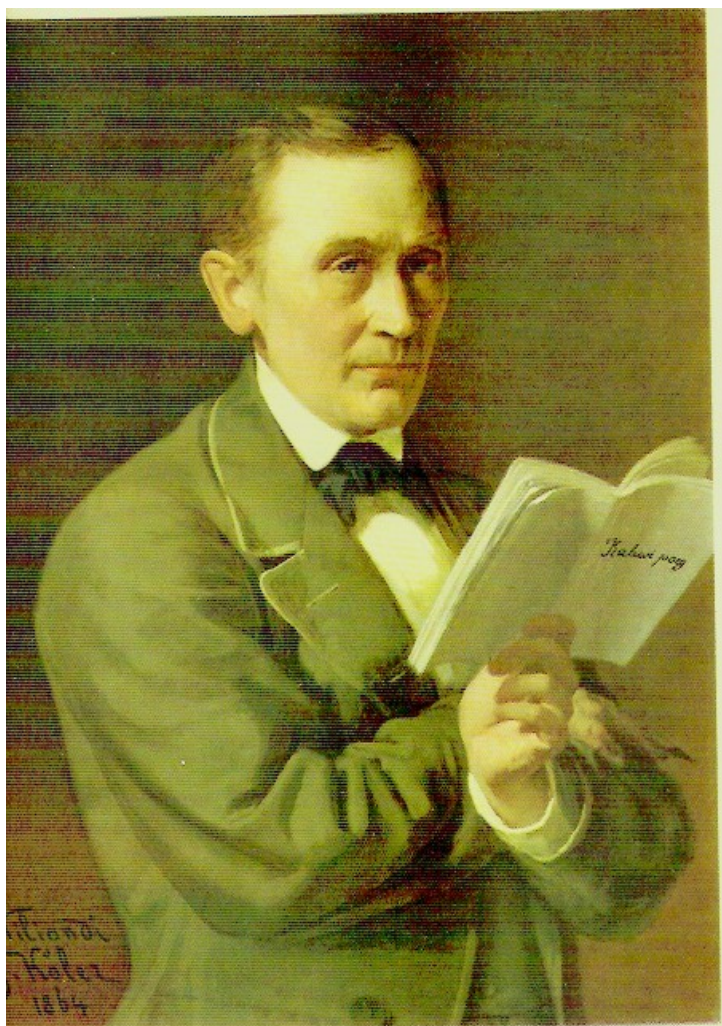
I. J. Kähler. Fr. R. Kreuzwald. Öll. 1864.