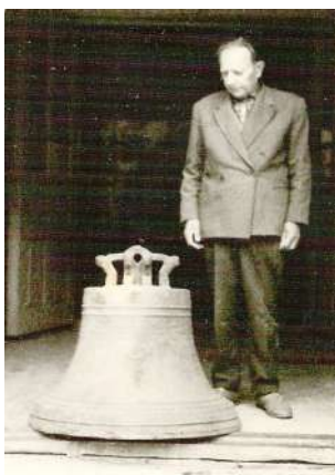
1969. aastal Tallinnast toodud tornikell lööb ka täna, ehkki mitte enam üksi ja hoopiski elektroonilise “kellamehe” abil.