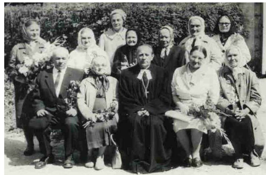
... ja Kuldleeri "lapsed" aastal 1968