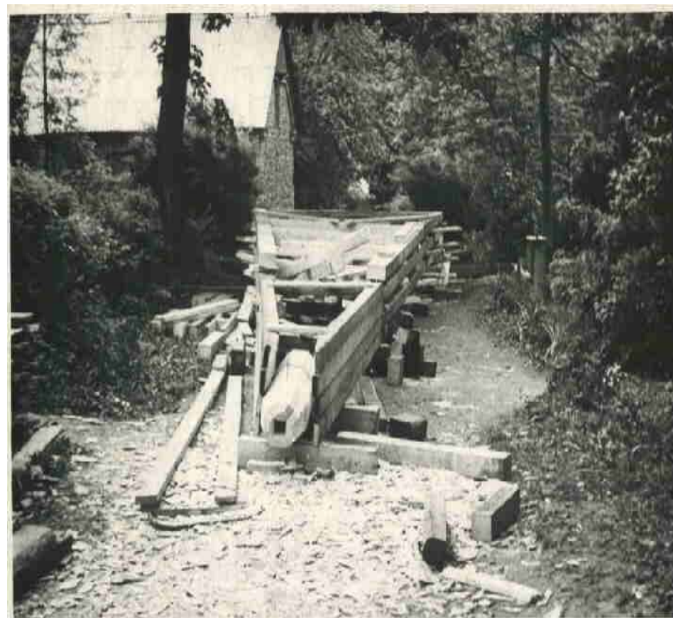
Fotomälestus tornikiivri taastamise ajast 1967, kui kiriku ümbrus ja kalmistu teed olid täis ehitusdetalle ja –materjale. Tornikiivri sõrestik tehti valmis maa peal.