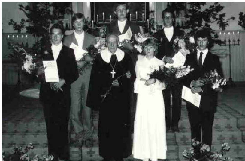
Auväärt õpetaja viimased leerilapsed Kadrinas 1986.aastal

Näed sa teisi nutmas ,ära mine sa nendest külmalt mööda , kuula hoolega! Ehk üks väike sõna armastuse väes trööstida võib seda, kellel silmad vees.