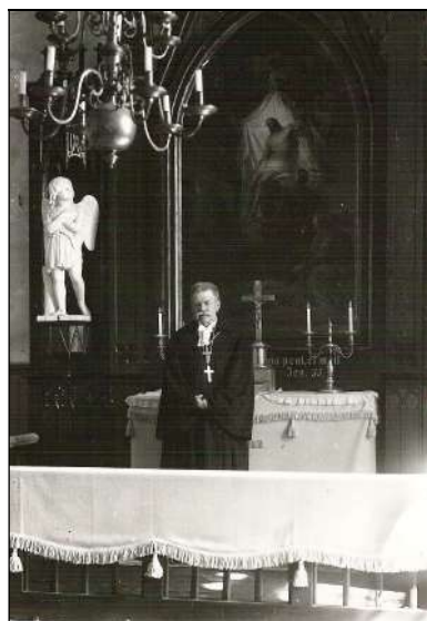
Kadrina pastor aastail 1919-1941

Tema eluteest räägib lähemalt trükis A-534 2004