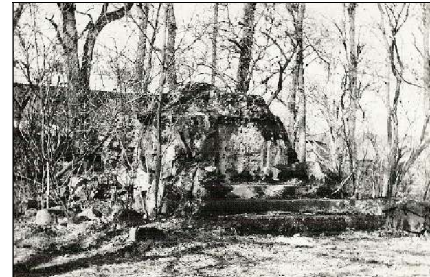
Mälestuskalju jäänused aastatel 1941-1990.

Mälestuskalju lõhkumiseks valiti aeg, mil rahval oli küllalt tegemist iseendaga, sest just oli toimunud 1941. a suurküüditamine. Õhkimine viidi läbi 18.06.1941 öö varjus. Mälestussammas oli aga väga vastupidavana üles laotud ning hävitustöö tegijad pidid pingutama kolm ööd järjest. Sellegipoolest jäi samba vundament ja tubli meetrine osa püsima. Väikeseid nurgasambaid ja muid kaunistusi peksid hävitajad kangidega puruks.