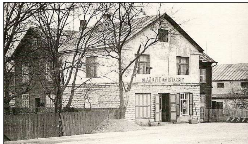
Majapidamistarvete kauplus Kauba tn 25