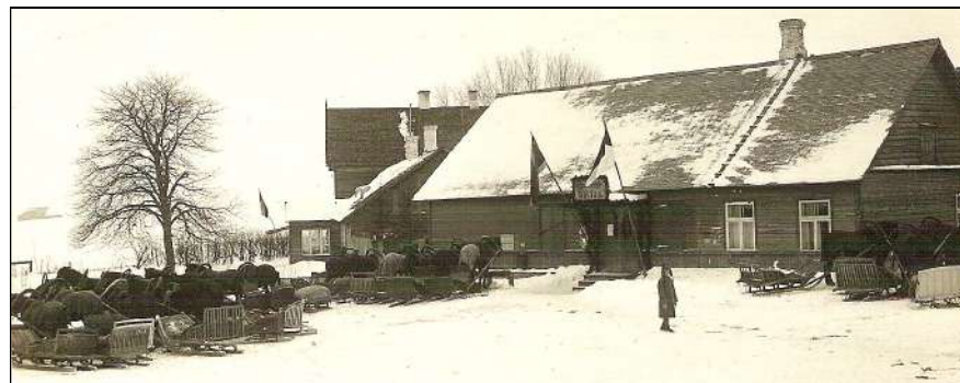
Kadrina Tarvitajate Ühisuse 10. aastapäev 1929. a. Kaeramootoriga liiklusvahend oli iga talupere lahutamatu osa.