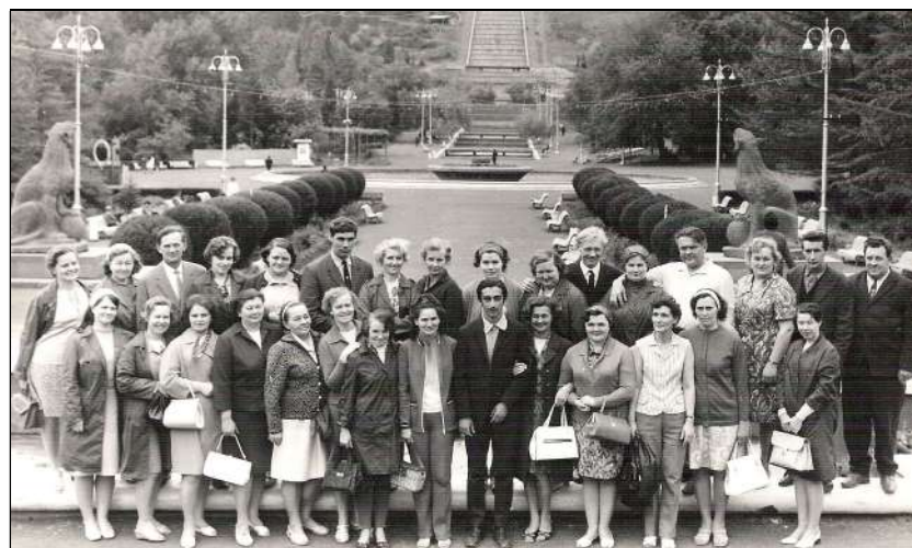
Kadrina Tarbijate Kooperatiivi töötajad Gruusias 1972.

Ostes käesoleva trükise, toetate Neeruti ja selle lähikonna loodushoidu, kultuuriloo jäädvustamist ja Neeruti Seltsi, mis selle nimel ellu on kutsutud.