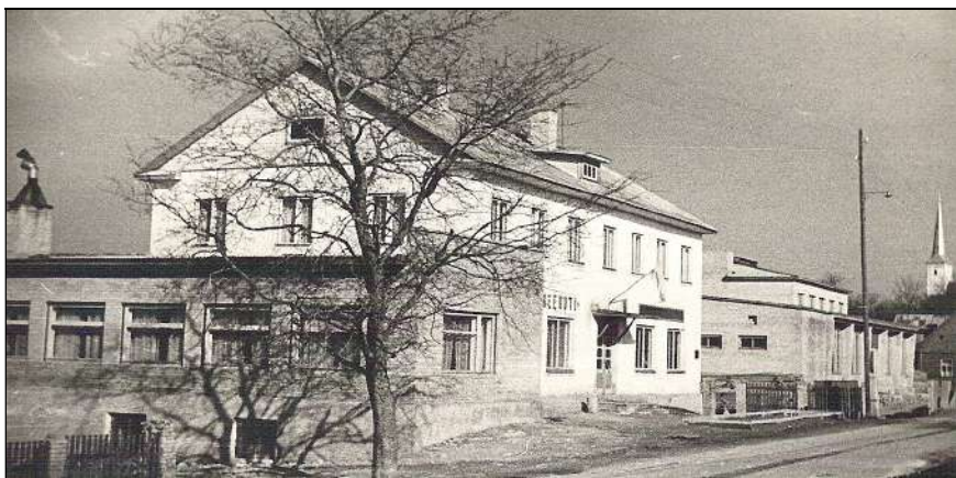
Uued hooned Viru tn 7 ja 9. Esiplaanil söökla ühekordne juurdeehitus ja kondiitritsehh selle otsas (näha korsten). Maja valmis 1961 põlenud hoone vundamendile. I korrusel olid söökla ja kulinaariakauplus, II korrusel 3 korterit ja kontor (nüüd OTO maja). 1969 valmis taamal olev selvekauplus ja kahekordne osa adminruumidega II korrusel (nüüd Nuka Kaubad).