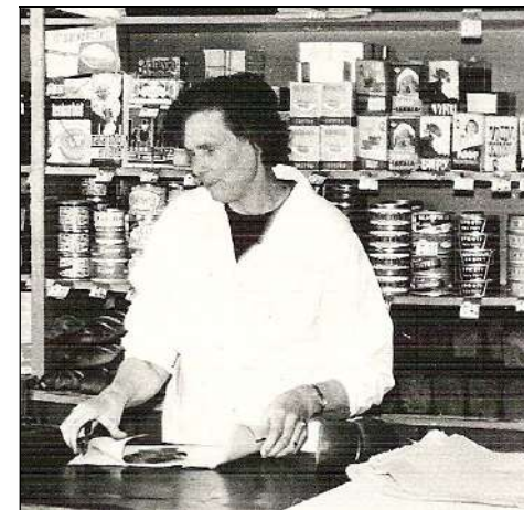
Valve Kivi Saksi kaupluses 1969. a.