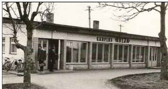
Hulja kauplusehoone, mis valmis 1960ndate aastate algul.