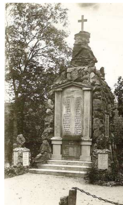
Kadrina kihelkonnast pärit langenutele mälestuskalju – Gustav Beermanni looming.