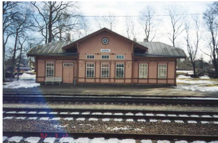
Kadrina endine jaamahoone 2002. aastal.