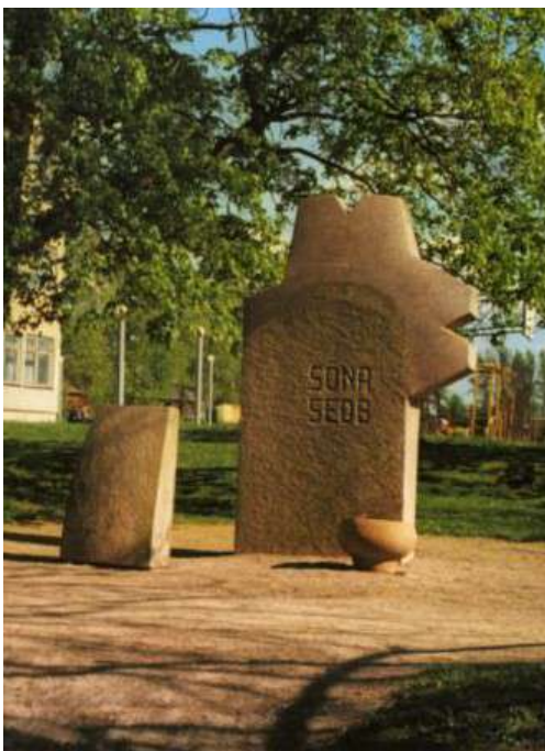
24. mail 1994 avatud Emakeeleausammas Kadrinas.