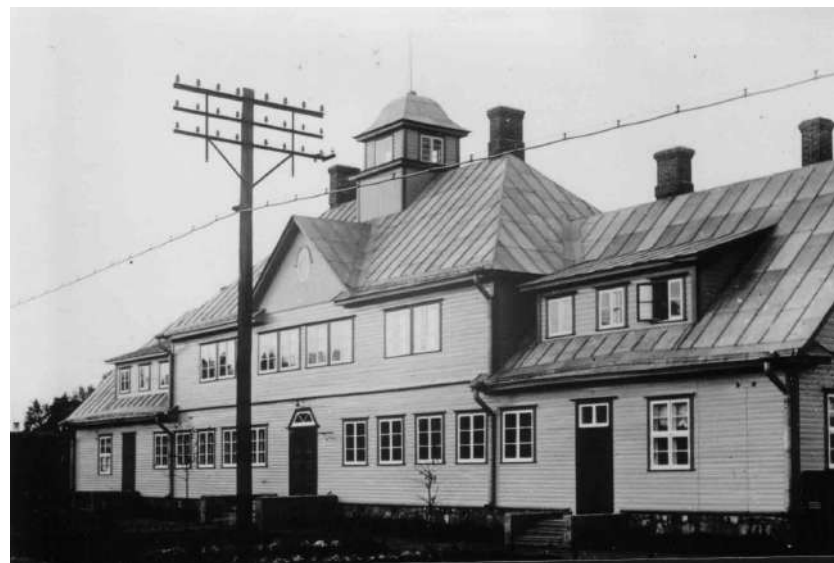
Kadrina Hariduse Seltsi maja, mis ehitati valmis 1930. a 9 kuuga.