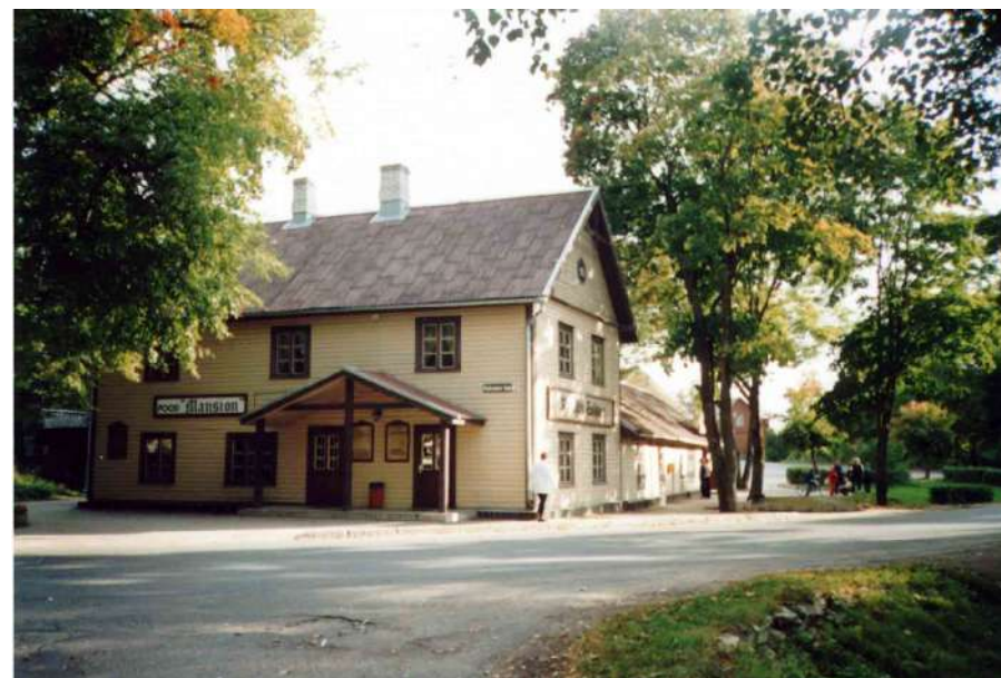
Kadrina vana koolimaja tänapäeval uues kuues ja funktsioonis.