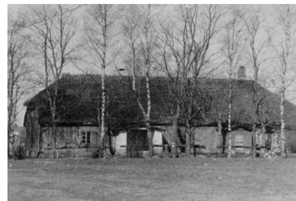
Vennastekoguduse palvemaja .