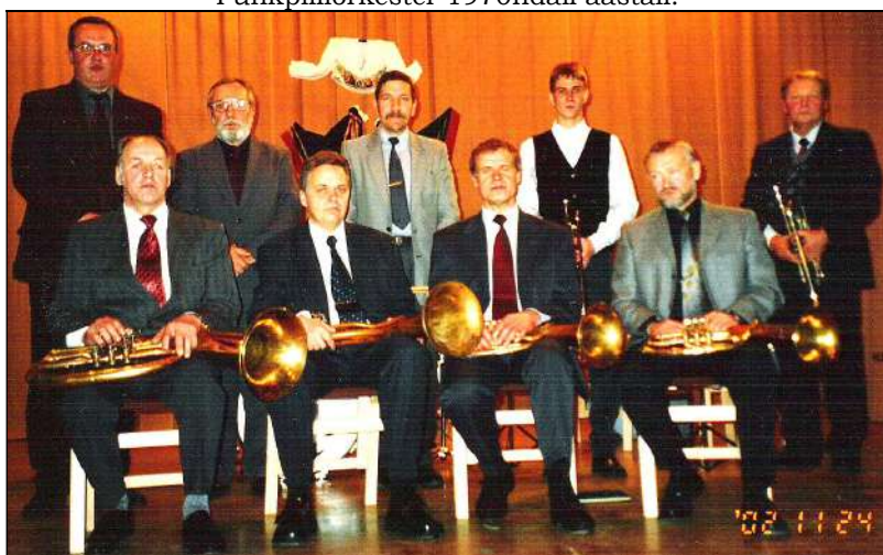
Kadrina rahvamaja pasunakoor aastal 2002.