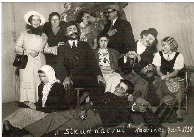
„Sikud kaevul“ lustist ja rõõmust pakatav trupp pärast edukat etendust 04.12.1938