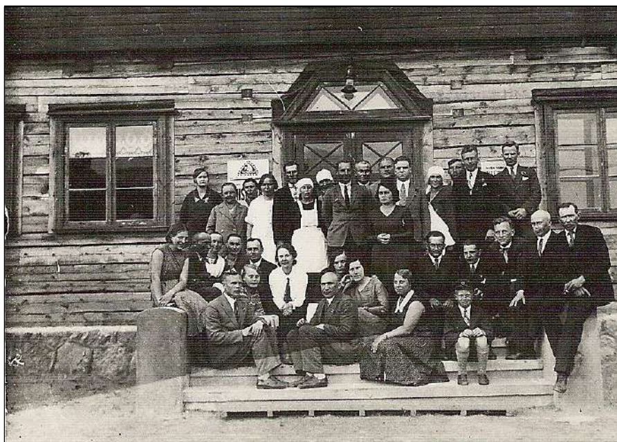
Entusiastlikud asjaosalised oma uue maja avaral trepil.

mist. Maarahvamajad ehitati pea kõikjal mitmeotstarbelised, kuid teist nii suurt ei olnud Eestimaal pikka aega: avara lavaga saal, esinejatetoad, kinoaparaadiruum, suure pliidiga tuba perenaiste seltsile, sisseehitatud seifiga ruumid pangale, raamatukogutuba, einelaud, ruum kaitseliidule ja naiskodukaitsesele. Ärklitoad olid korteriteks palju aastaid. Selline oli saavutus, mille need tublid inimesed ehtasid, etlesid, tantsid ja laulsid sillaks meieni, kes me tänapäeval võime seda ajaloo ja traditsioonidega maja keset Kadrinat ikka omaks pidada.