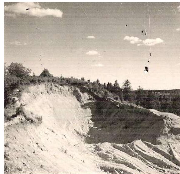
Eestlaste muistne linnusease Linnamägi veeti 1950ndate aastate algul Tapa sõjaväelennuvälja ehituseks.