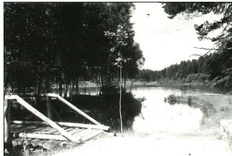
Neeruti mõisnike jäljed Karuaugu mägedes