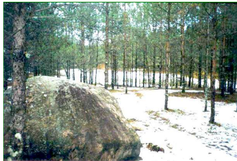
Neeruti ja tema lähikonna ajalooline taust Kirjutanud Eduard Leppik, vihik A-503, NS Toimetised 2002

Näete, me oleme saanud pika rea pidepunkte, mis, kohapeal uudistades, mitmeks tunniks tuumakat äraolemist võimaldavad. Nii et teadmised ja tervis lausa käsikäes. Et selles veenduda, on vaja loobuda tehiskeskonna “mugavustest”, tulla Neerutisse, siin olla, matkata, tunnetada oma osalust, nautida rikkumata loodust. Ja kõik!