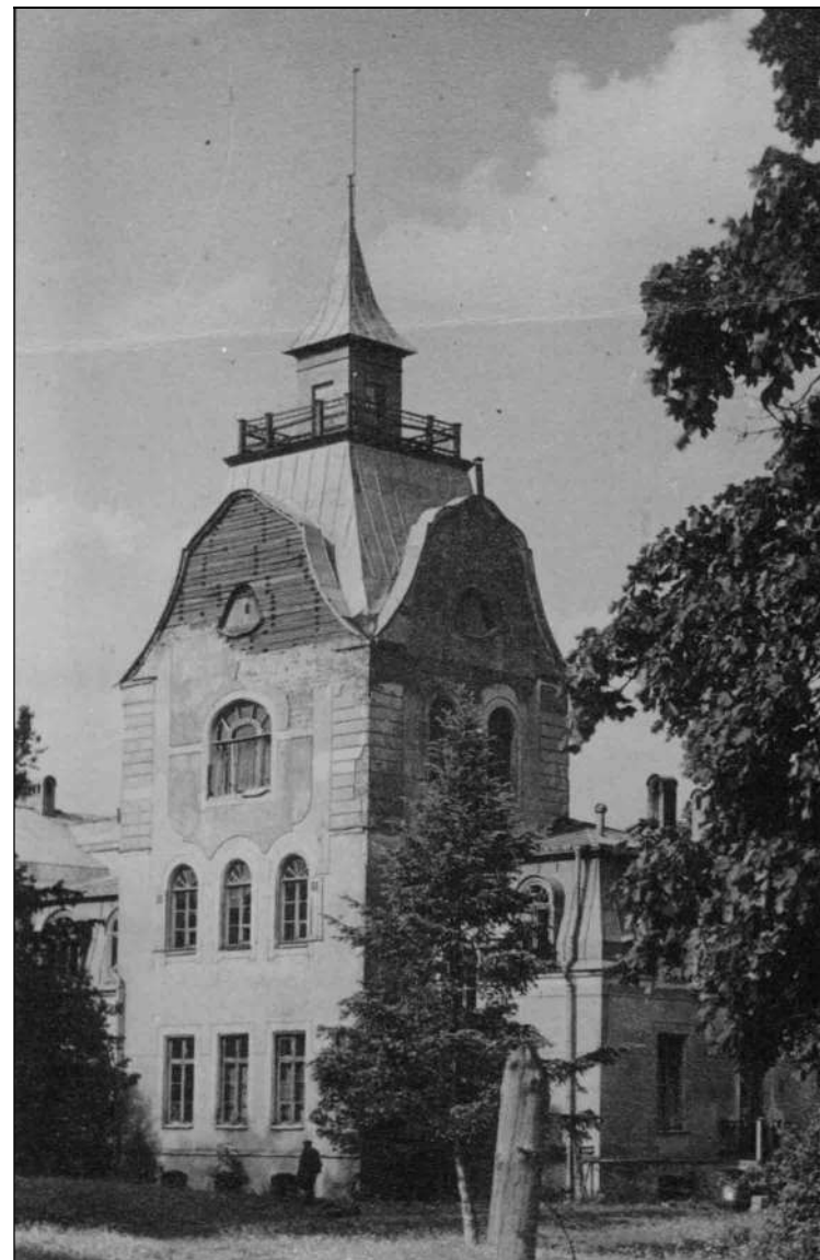
Neeruti mõis enne Teist maailmasõda