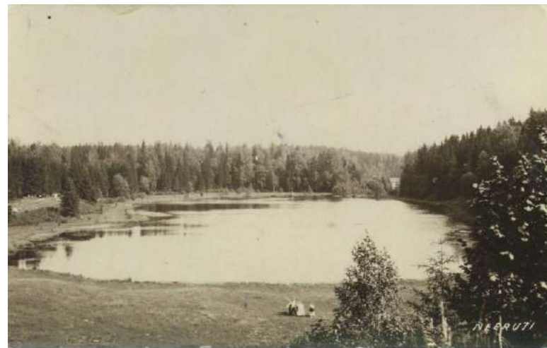
Neeruti Eesjärv XX sajandi I poolel, mil vaade järvele oli veel sinna hiljem kasvanud puudest varjamata.

Ostes käesoleva trükise, toetate Neeruti ja selle lähikonna loodushoidu, kultuuriloo jäädvustamist ja Neeruti Seltsi, mis selle nimel ellu on kutsutud.