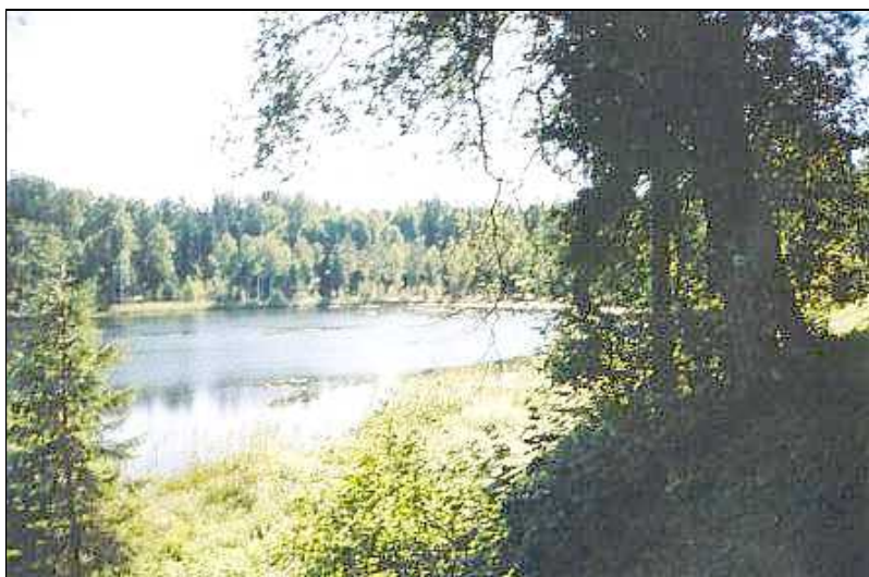
Neeruti MKA järvestik, vooluveed ja tehisveekogud

Kirjutanud Eduard Leppik, seni avaldamata