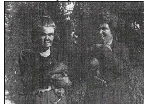
Fotod ajakirjast VALLATU MAGASIN nr 3 1937 (suvi)

Mõlemad erakuiks muutunud naised ei taha aga sellest kuuldagi ja kui ametimehed nende elamule lähenevad, jooksevad nad koguni metsa. Nad räägivad, et onnis olevat neil päris lahe ja mõnus olemine, sest nad on vooderdanud onni seestpoolt põhjalikult sõnajalgadega, mistõttu külm üldse sisse ei pääsevat. Kuid viimane tugev külm võttis ometi ära nende ainsad hoolealused, kanad, kes elutsesid naistega ühes ruumis. Vallavalitsus otsustas naised nüüd sunniviisil vanadekodusse paigutada.