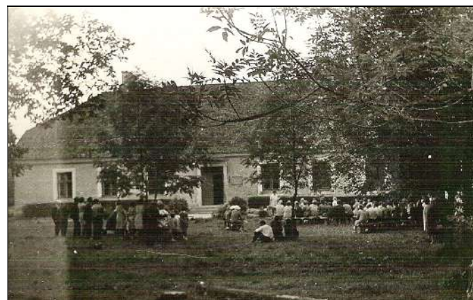
1971. a augustikuus Kogunes oma vana kooli juurde hulganisti endisi õpilasi, õpetajaid, töötajaid.