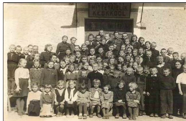
Neeruti kool aastail 1949/50, mil kooli nimetati mittetäielikuks keskkooliks, seega andis kool seitsme- klassilise hariduse.