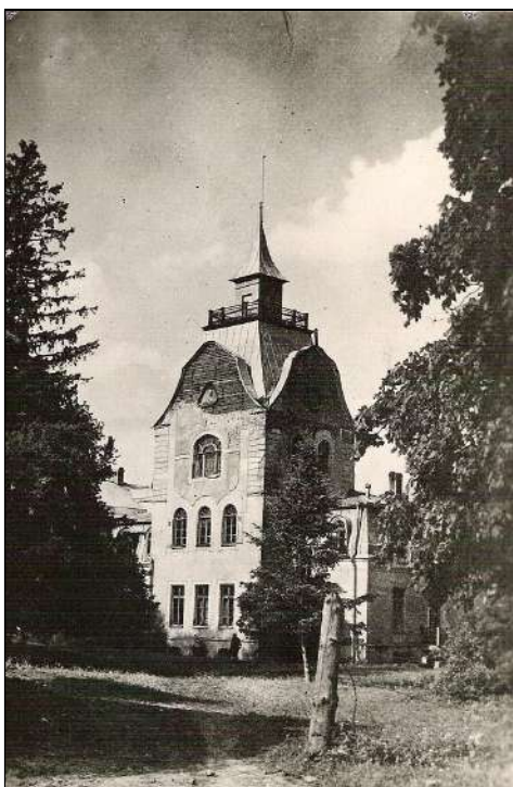
Neeruti mõis 1930ndail aastail

Kaaneafotol Neeruti koolimaja, endine mõisavalitseja maja.