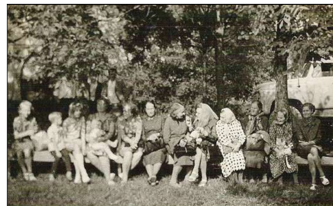
Kooli lõpetamist austas oma kohalolekuga hulganisti soliidsesse vanusesse jõudnud kunagisi õpilasi