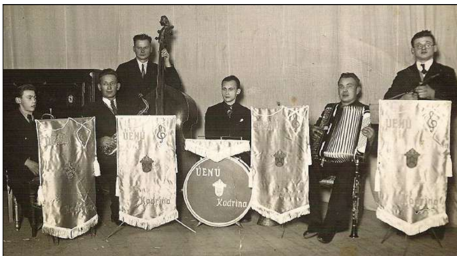
Foto on tehtud 12. novembril 1939 Kadrina Hariduse Seltsi peol, mil orkestri esinemissära suurendasid säravad puldikatted.