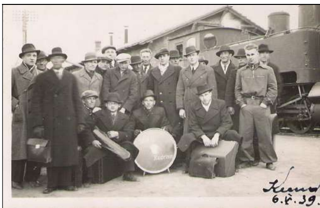
Kirje foto tagaküljel: Ü.E.N.Ü.

Kadrina osakonna maadlusmeeskond ühes orkestri ja külalistega Kunda saabumisel 6. mail 1939. a Kunda raudteejaamas. Juku keskel heleda soniga.