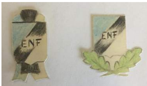
Foto 5. Eesti Noorte Föderatsiooni märgi kavand.

KGB püünistest polnud pääsu. Ülo lõpetas 1950. aastal Kadrinas 7. klassi ning siirdus Rakveresse keskkooli. Salme Augjärvi (Talu) lõpetas ka Üloga samal kevadel, kuid läks õppima Pedagoogilisse kooli. Majanduslikult ei olnud Ülol võimalik päevakoolis õppida, mistõttu läks ta õhtukooli. Siis algasid probleemid töö saamisega. Emalt polnud toetust loota, sest tollastes kolhoosides töötasu rahas peaaegu ei makstud. 1951. aastal tulid ka teised rühma liikmed Kadrinast Rakverre õppima. Seal hakkas Ülost kujunema vastupanuvõitlejate grupi juht, kuigi Ülo kinnitas, et tead selleks ei valitud. Nuputati oma põhikirja kallal ning kavandati sümboolikat (foto 5).