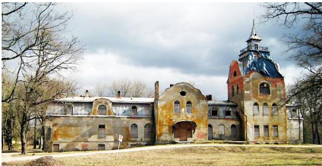
Foto 1. Neeruti mõisa härrastemaja, kevad 2007 77