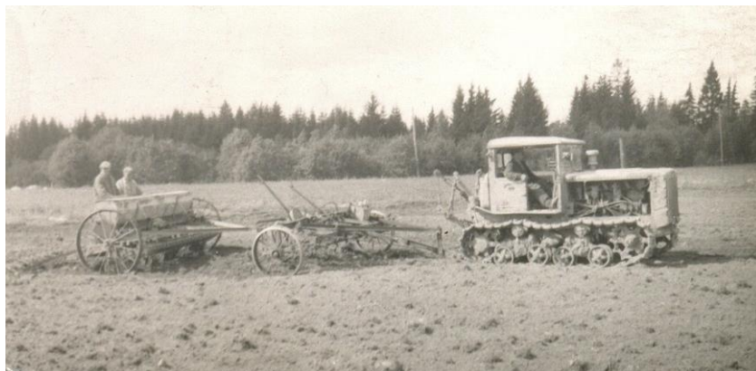
Foto 3. Kevadkülv traktoriga T54 1960. aastate algul.