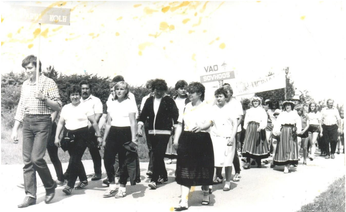
Foto 5. Majandite vaheline spartakiaad 1984. aastal.

Kolhooside „õitseajal“ olid töötajate palgad korralikud. Juhan sai kuupalka umbes kakssada rubla, lisaks juurdearvestus ja preemiad. See oli vanemspetsialisti palk. Hästi teenisid ka lüpsjad ja traktoristid.