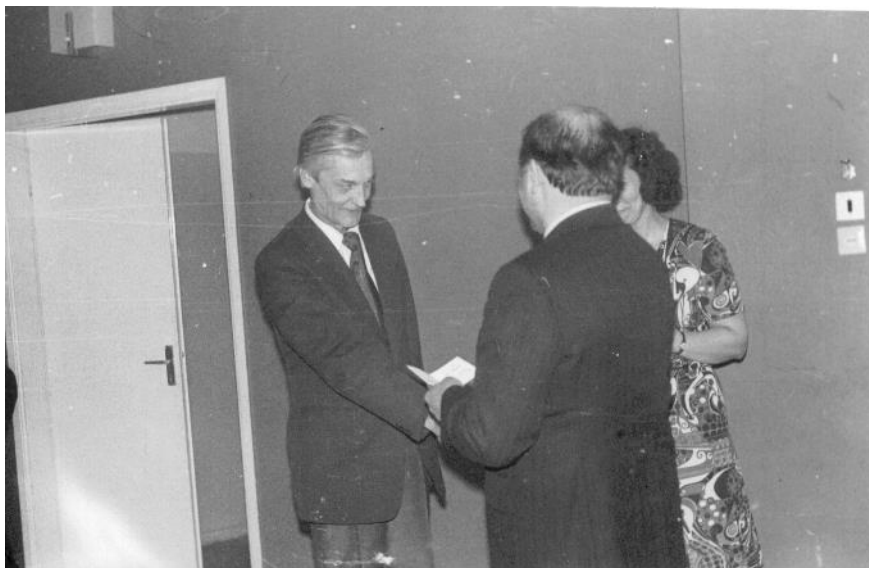
Foto 6. Külaliseks oli näitleja Ervin Abel.

käisid ka sõjaveteranid. Kui ei olnud külalisi väljastpoolt, siis olid kohalikud. Jaanipäeval olid suured pidustused, nagu praegugi. Ainult siis tähistati ikka rohkema viinaga.