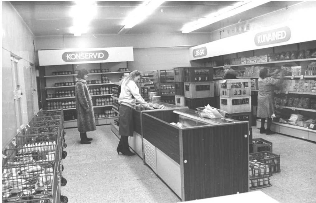
Foto 8. Vohnja küla pood 1980. lõpuaastatel

Allikas: Vohnja kolhoos. SA Virumaa Muuseumid. RMF 1543_22.jpg