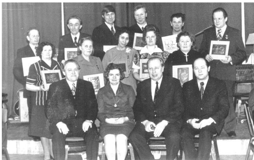
Foto 1. Eesrindlaste autasustamine 1975. aastal.