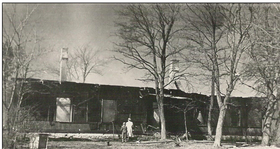
Vallamaja, milles elas mitu perekonda, pärast põlengut.